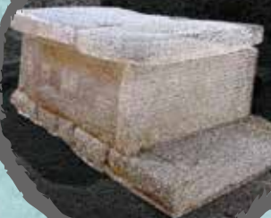
石棺の3D画像 (女谷・荒坂横穴群：八幡市)