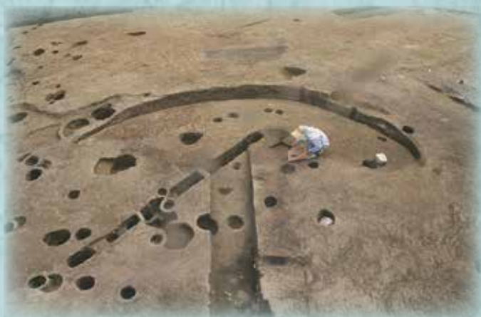
石田谷遺跡（与謝野町）