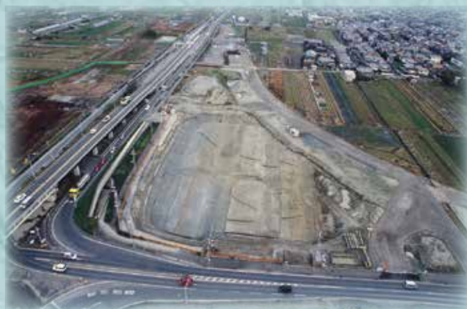
下水主遺跡（城陽市）