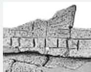
家形埴輪の鱗飾り