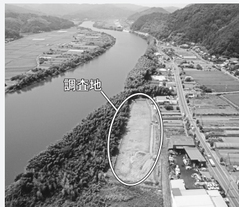
由良川と調査中の大川遺跡（昨年度の調査地）

輸入陶磁器の中には、出土例の少ない高麗や朝鮮王朝などの時期に朝鮮半島で焼かれた陶磁器が数点ですが含まれます。これらは14～15世紀のもので、ヘラで文様を削った中に白い化粧土を入れて焼いた高麗の象嵌青磁や、鉄分の多い鼠色の陶土に白土を化粧掛けし、その上から透明釉を施して焼いた朝鮮王朝の粉青沙器があります。