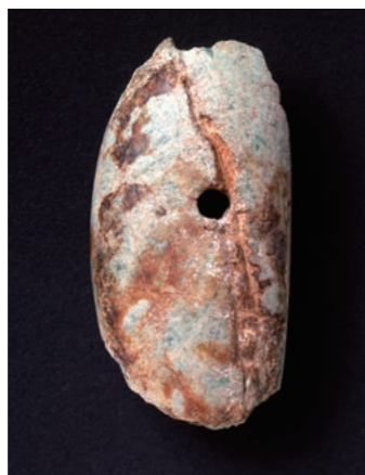
タテ 7.5cm、ヨコ 3.95cm

翡翠製大珠は全国的にみられますが、その主な出土地は東日本です。しかしながら、京都府や奈良県などでも少なからず出土しています。その数少ない出土例の1つが写真の精華町椋ノ木遺跡の翡翠製大珠です。