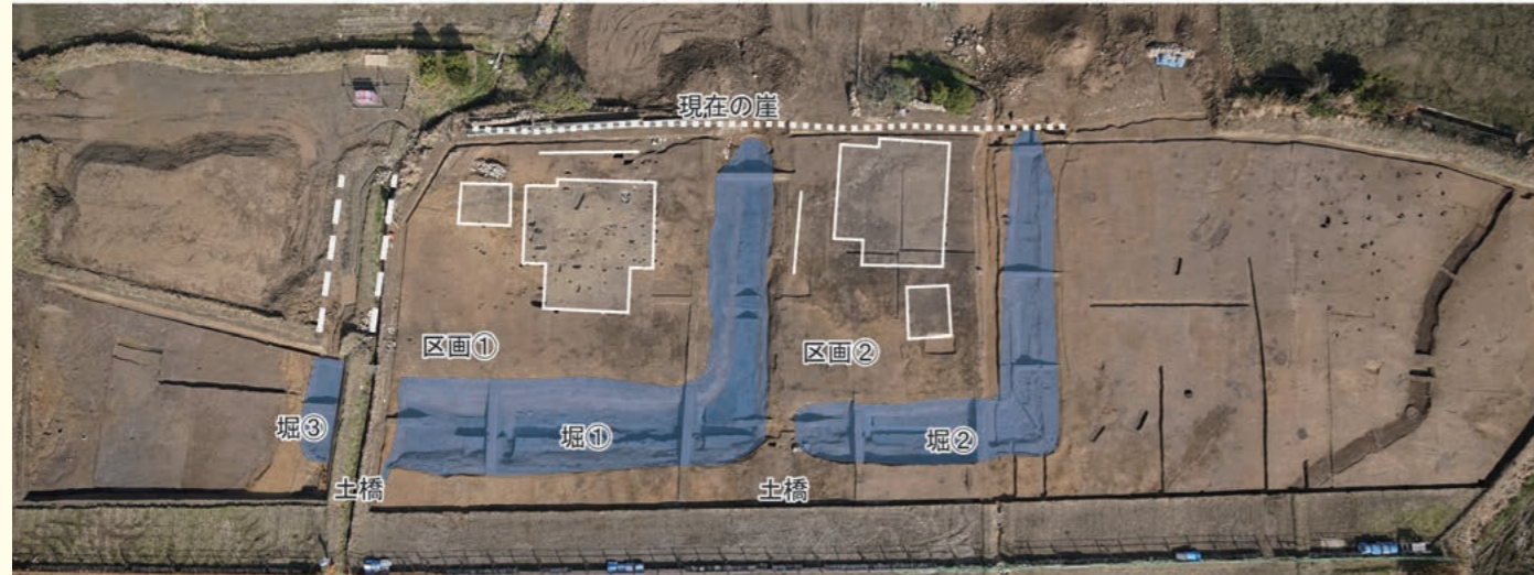
犬飼遺跡で見つかった居館